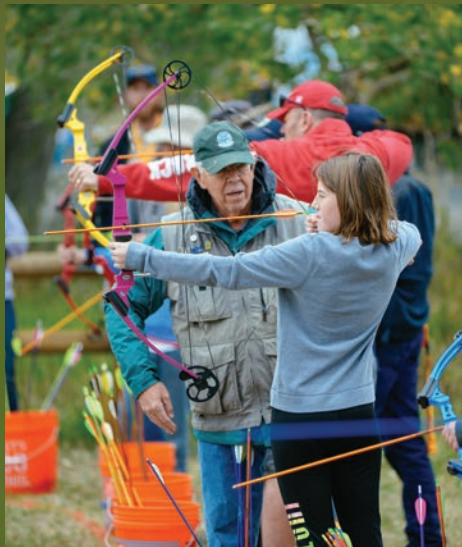
Un voluntario de CPW enseña a una niña a disparar un arco compuesto en la primera Exposición de Aventuras al Aire Libre, que organiza CPW en Cherry Creek State Park.

Esa financiación fomenta las iniciativas para conservar y mejorar el hábitat silvestre y para ayudar a proteger a los cientos de especies distintas que consideran a nuestro estado como su hogar.